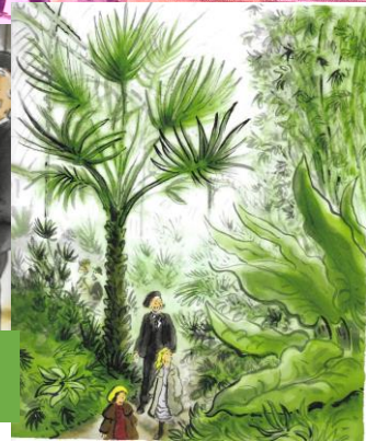
Illustrations de l'album Charlotte et le douanier Rousseau

Le douanier Rousseau, un magicien des couleurs: Le douanier Rousseau excelle dans les mélanges de couleurs, Ce qui lui permettra d'obtenir 22 verts différents dans certains de ses tableaux. Malheureusement ses tableaux seront critiqués durant sa carrière de peintre. Son talent ne sera reconnu qu'à la fin de sa vie. Ses tableaux sont maintenant exposés dans tous les musées du monde. Allez les admirer au musée d'Orsay ou au musée de l'orangerie, à Paris!