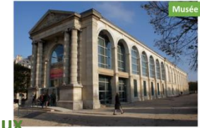
Musée de l'Orangerie. Jardins des Tuileries

Allez voir les œuvres du Douanier Rousseau exposées à Paris