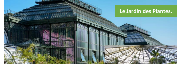
Le Jardin des Plantes.

Le douanier Rousseau, un magicien des couleurs: Le douanier Rousseau excelle dans les mélanges de couleurs, Ce qui lui permettra d'obtenir 22 verts différents dans certains de ses tableaux. Malheureusement ses tableaux seront critiqués durant sa carrière de peintre. Son talent ne sera reconnu qu'à la fin de sa vie. Ses tableaux sont maintenant exposés dans tous les musées du monde. Allez les admirer au musée d'Orsay ou au musée de l'orangerie, à Paris!